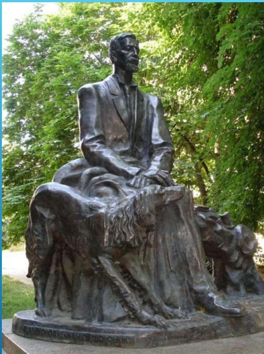
Памятник Ивану Бунину в Воронеже.