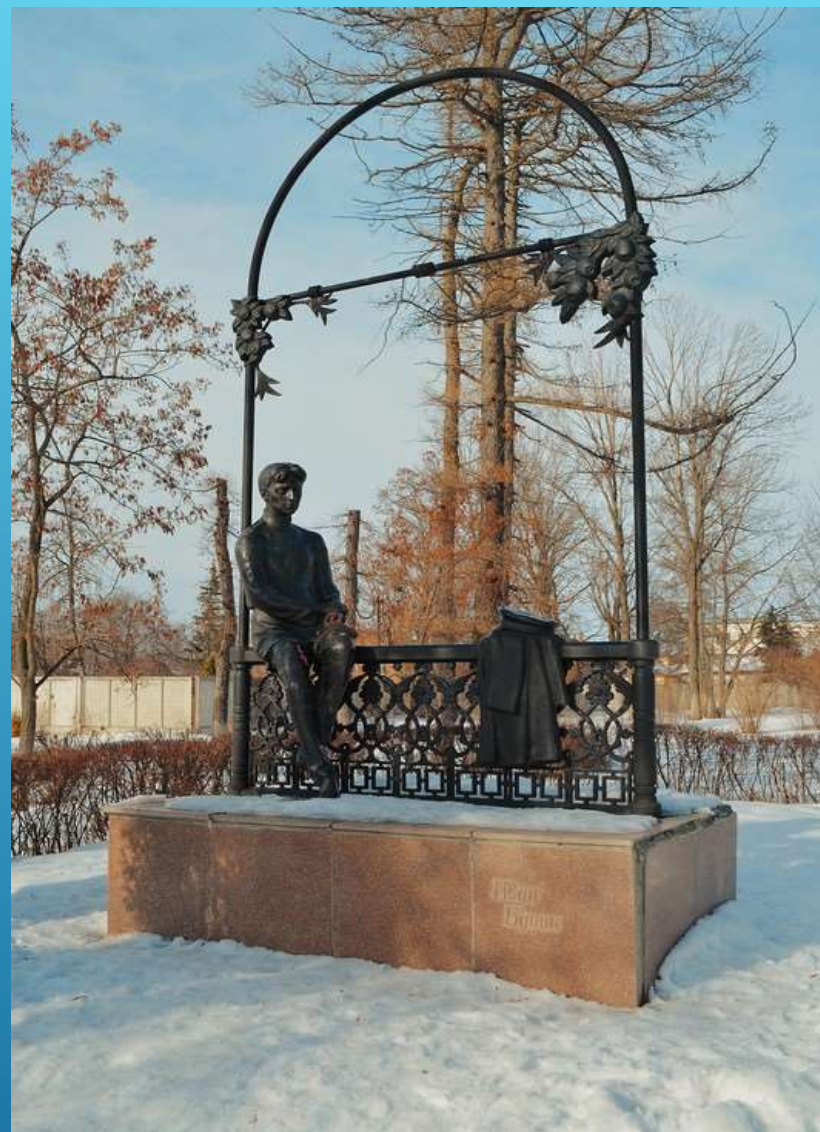
ПАМЯТНИК ИВАНУ БУНИНУ В ЕЛЬЦЕ